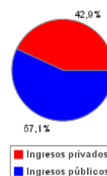
Ingresos Públicos y Privados